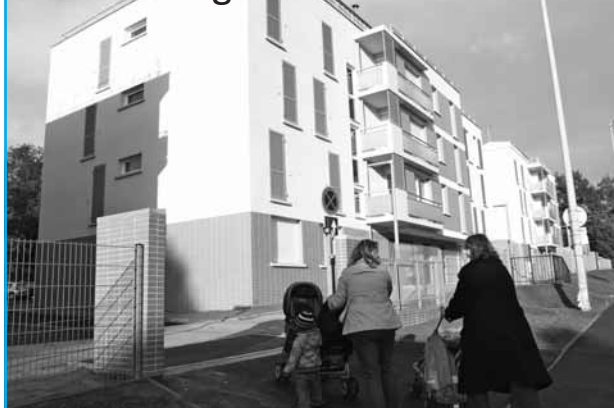
Opération de rénovation urbaine : les 1 res familles emménagent