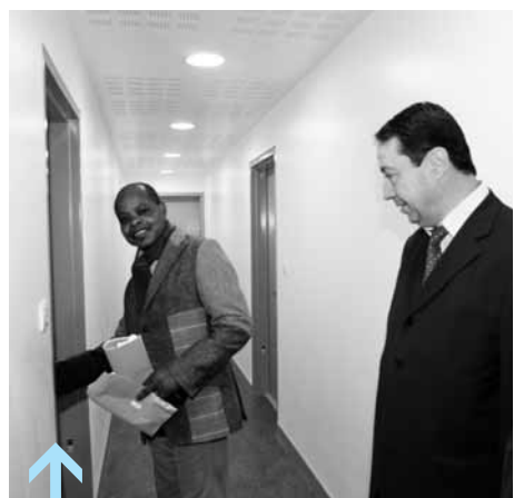
Le premier coup de clé avant de rentrer dans son nouvel appartement.

Emotion et sourire. Mais aussi un peu d'appréhension avec la gestion du déménagement et la nouvelle installation. Depuis le début de semaine, cet éventail de sensations est quelque chose de palpable et de partagé chez plusieurs habitants des Emmaüs Saint-Michel. Les premières familles ont en effet emménagé dans leur nouveau lieu de vie ! Une installation qui s'est faite aussi bien dans quelques-uns des pavillons construits dans le quartier de Guinette, aux Hauts-Vallons, que dans certains appartements des résidences qui viennent d'être achevées boulevard Saint-Michel.