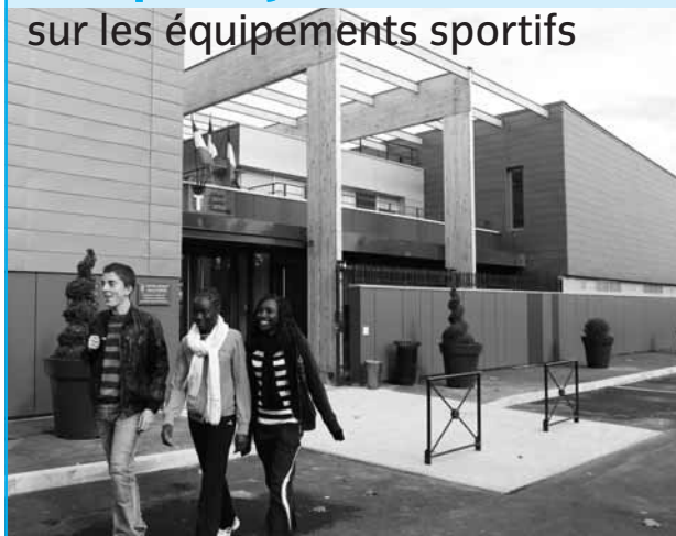
Le centre sportif Michel-Poirier inauguré