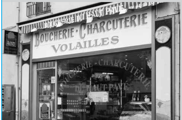
La boucherie du Haut-Pavé 2 e prix des Papilles d'Or