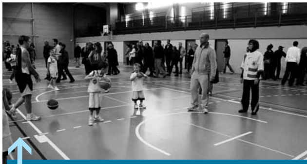
Démonstration de baby-basket lors de l'inauguration.