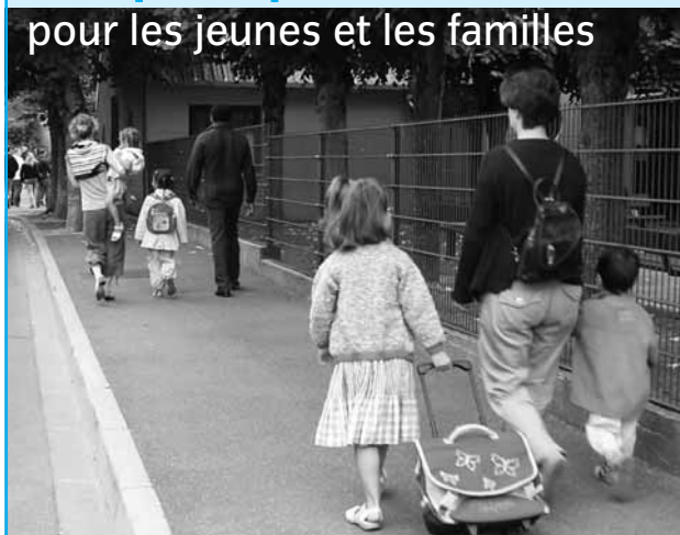
Présentation des différentes aides disponibles